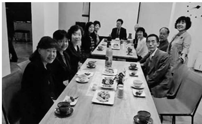
ホームビジット (22日午前の建築家宅で)

22日午前、2年前改築された建築家の事務所で、今回も茶菓の接待を受けました。素敵な設計に