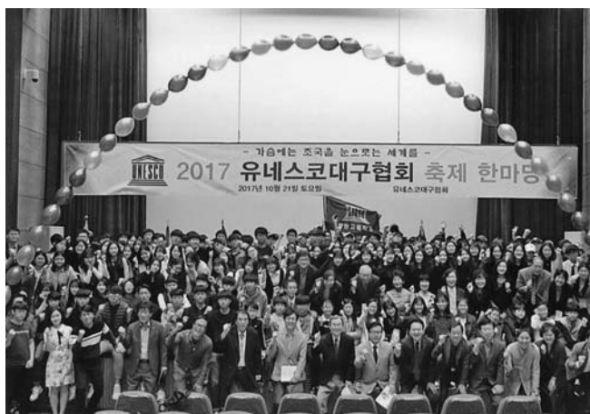
ユネスコハンマダン祝祭 (21日)

韓国ユネスコ大邱協会は下部組織として、中・高校生のユネスコ活動を推進する活動があります。毎年10月、200名以上の参加があります。役