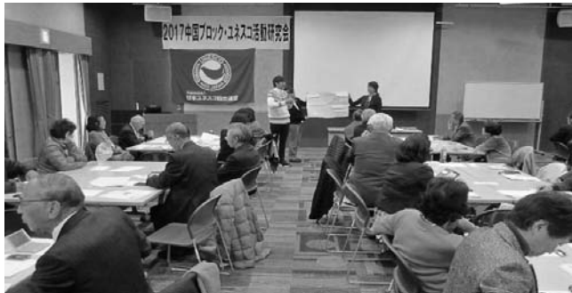
中国ブロック研究会のワークショップの様子＝山口・防府市