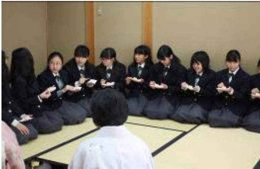
高校生が茶席の体験

平成 29 年 1 月 29 日（日）越谷能楽堂で開催しました。約 400 名のお客様にきていただき楽しめました。準備・運営にたくさんの方に協力していただき、経費を指しひいて、約 38 万円の資金となりました。