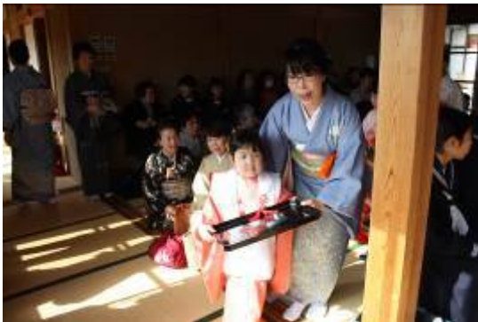
かわいいお子様が一生懸命おもてなし