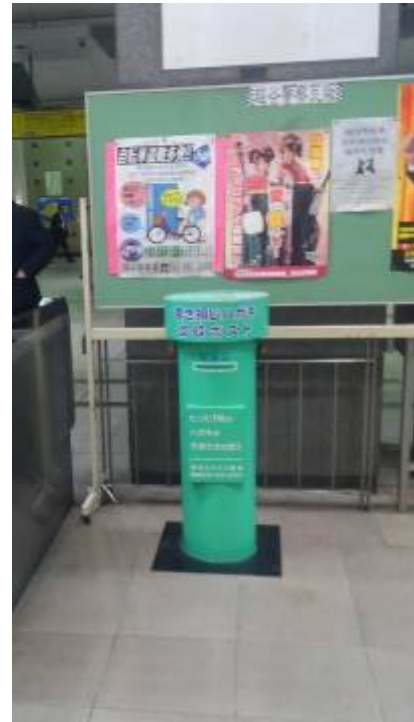
越谷駅書き損じはがき回収ポスト

●東武線越谷駅・北越谷駅・せんげん台駅・越谷市役所・越谷市立図書館（緑色ポスト）