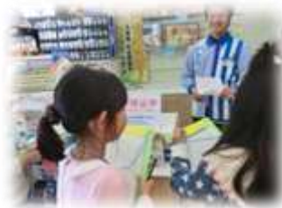
3年生 お店でインタビュー

低学年のうちに人とつながることを楽しむ「人権基礎総合学習」、中学年で自分の得意を生かしつつ相手を意識した活動を展開する「パフォーマンス系総合学習」、地域から学ぶ「地域系総合学習」、それらを基盤として高学年でよりよい社会づくりに参加する「人権起業家教育」へと、6年間かけて積み上げていきます。