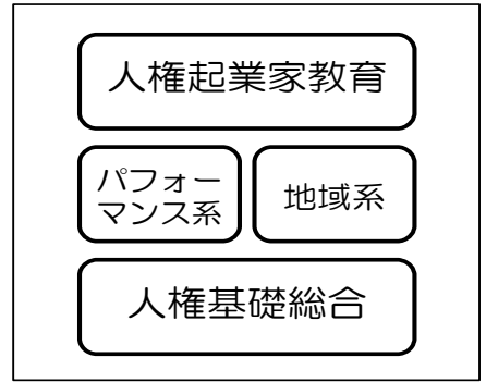
人権総合学習の積み上げ

文部科学省の「人権教育の指導方法等の在り方 第3次とりまとめ」では、他者の違いを大切にしながら社会に参画し自己実現をめざす子どもの育成が提起されています。萱野小学校では、他者の人権や違いを尊重しながら、人とのつながりを基盤に社会の中での自己実現できる子どもの育成をめざす市民性教育の理念がこれからの人権総合学習の進むべき方向であると考え、地域とともに実践をつくっています。