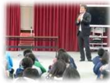
6年生 地域で活躍する先輩のお話を聞こう