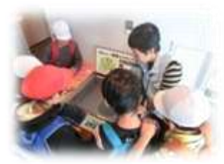
4年生 防災センター 聞き取り体験