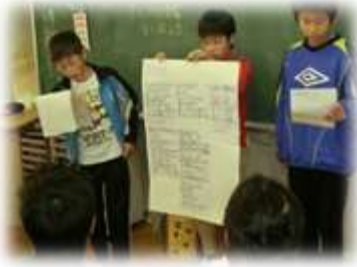
5年生 日本文化の発表