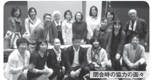
閉会時の協力の面々