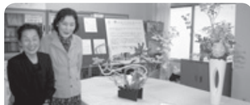
草月流いけばな教室 第3回 2,000円

【中国語】在仙大学で教鞭をとる屈明昌先生。月3回の土曜日午後。初級、文章読解、会話の順で、話題満載の内容が魅力です。(1回4時間1500円)