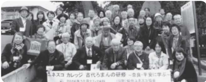
ユネスコカレッジ 古代ろまんの研修 - 会長・平安に学ぶ - 2016年10月27-28日 (会場: 仙台ユネスコ協会)