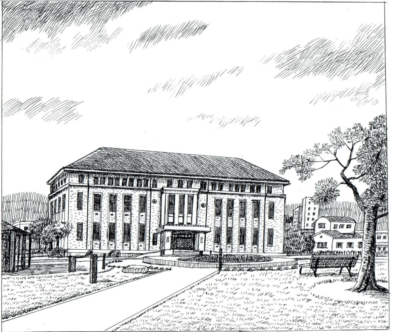
旧岡谷市役所庁舎（岡谷市）国指定登録文化財(建築物) 挿絵：谷澤信憲

製糸業が盛んで、「シルク岡谷」として世界に名をはせた平野村(現岡谷市)は、大正時代、全盛期を迎えていました。しかし、昭和4年の世界恐慌で大きな打撃を受け、それを打開、再出発するために、当時の村会では本格的市政施行に向けて準備を始めました。その必要条件のひとつに庁舎の整備がありました。