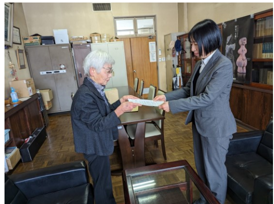
宮川小学校にて感謝状贈呈

本年も多くのハガキを回収し、それを切手に交換し日本ユネスコ協会連盟本部へ送ることができた。