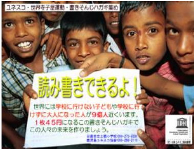
鹿児島県・日置市立土橋小学校 4・5・6年生