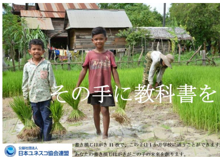
東京都立三田高等学校 Y・Y