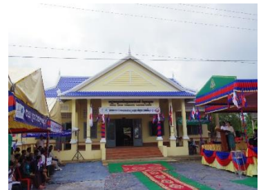
2017年度完成・スラエン・スピアン寺子屋

リーフレットコンテストに代表作品を提出し、書きそんじハガキの回収や募金活動で「ユネスコ世界寺子屋運動」にご協力いただいた学校は約1年後、支援地のカンボジアに新しい寺子屋を建設した場合、銘板に学校名が記載されます。