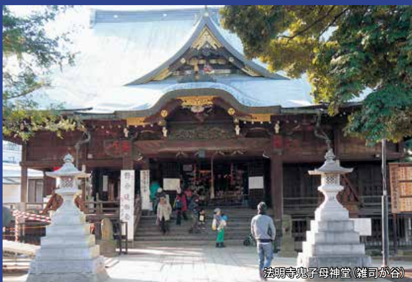
法明寺鬼子母神堂(雑司が谷)