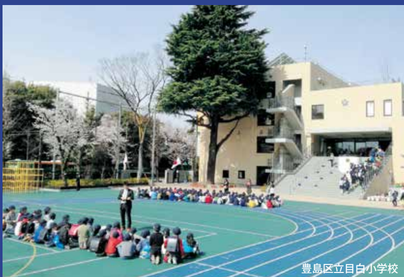
豊島区立目白小学校