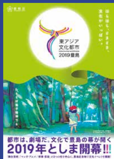
H4-東アジア文化都市(豊島区)