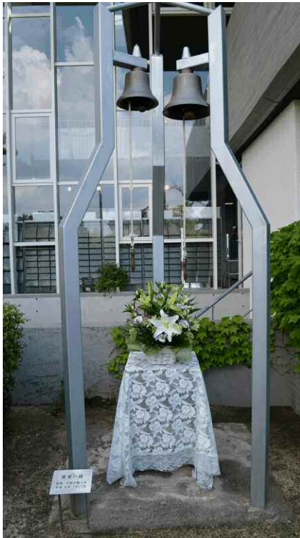
「優愛の鐘」(寄贈: 芦屋市婦人会)