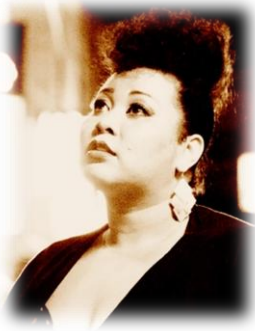
バレンシア・ウィリアムズ アメリカ シンガー、 ヴォイストレーナー

わたしたちが、このプログラムにゲストとして協力します。都合の合う日の参加ということで、いつになるかはお伝えできませんが、皆さんとお会いするのを楽しみにしています!!