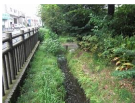
小川一丁目緑地と小川用水