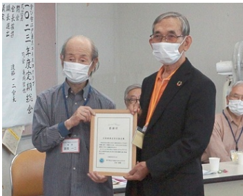
中国健康法普及協会