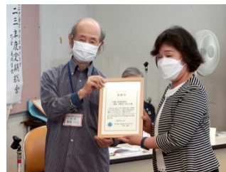
三味線・お座敷唄(代理)