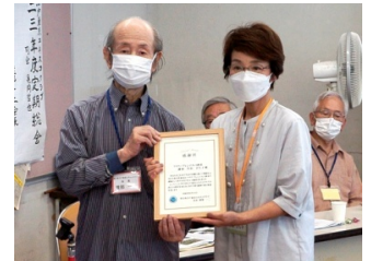
フラワーアレンジメント