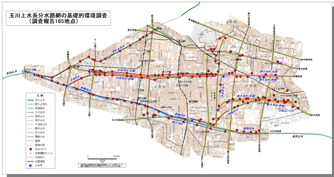
撮影地点拡大図 小川分水 南堀・北堀

会場内には、「わがまちの宝もの遺構 100 選」に小平市内で「玉川上水 10 地点と用水路 9 地点が認定」この 19 地点のパネルを展示しました。