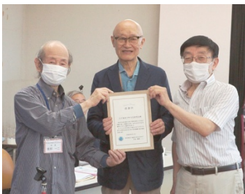
江戸東京下町文化研究会