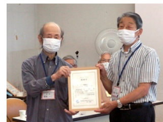
玉川上水自然観察会(代理)