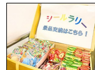
シールラリー景品