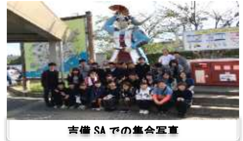
吉備 SA での集会写真

箕面ユネスコ協会は、地域や学校と被災地をつなぐ活動や、現地に出かけ交流する生徒や先生を支援する活動を行っています。東日本大震災以来、九州北部豪雨や熊本地震、岡山県倉敷市真備の豪雨災害等、大きな被害を受けた地域の支援活動や西日本豪雨災害を受けました。青少年による被災地ボランティア活動をとおり、復興の状況を知ることや、被災にあった方と出会うことで、生きること、命の大切さ考えることや、被災地を「忘れない」。被災地の問題や課題を自分のこととしてとらえる気づき生まれ、さらに、交流を通して被災地への理解を深めることを期待して支援活動を続けてきました。そこで活動してきた若いメンバーが箕面ユネスコとして共に新たな活動を展開していくスタートを切りました。