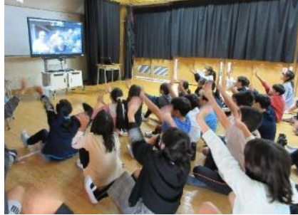
グラシャス！アディオス！スペイン語で元気いっぱいのお別れです