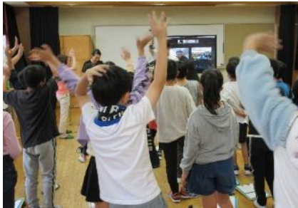
この日は、ナマステ～ダンネバード！で元気にお別れです