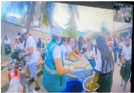
校門前で朝食を手に入れ授業に向かいます。授業はお昼まで。午後は違う生徒さんたちが学校で学ぶそうです

10月6日、ボリビアの子どもたちとオンライン授業を行いました。時差はマイナス13時間。そのため、開始時刻は、北小は朝の8:30、ボリビアは夜の19:30です。箕面出身のファミリーとご近所の子どもたちの協力で実現しました。ボリビアの子どもたちのプレゼン～アマゾンの様子や学校生活の紹介～から授業スタートです。