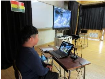
学校のこと、アマゾンの生き物のこと、人気のペットのことなど、次々に質問して答えてもらいました