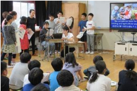
はじめに、学校生活の紹介です。北小からは子どもたちがしっかりした英語でプレゼンしていききました

11月6日、ネパールの子どもたちとオンライン授業を行いました。事前授業でネパールでの経験を伝え、当日に臨みました。時差は、マイナス3時間15分。北小の開始時刻は13:40、ネパールの学校10:25です。箕面ユ協として初めて出会う学校でときどきでしたが、この機会に新たなつながりができたことを嬉しく思います。