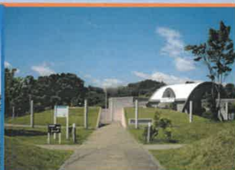
東松島縄文の村資料館