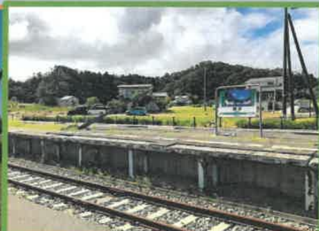
東松島市震災復興伝承館(旧野蒜駅)