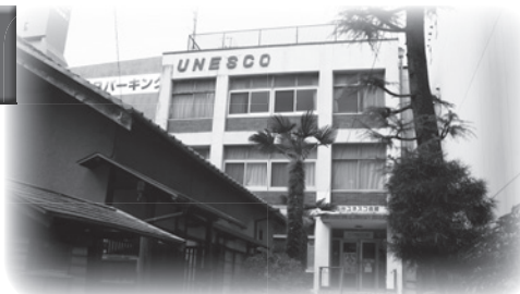
2016年3月8日 ユネスコ会館を撮る