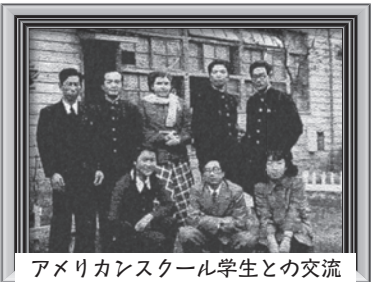
アメリカンスクール学生との交流