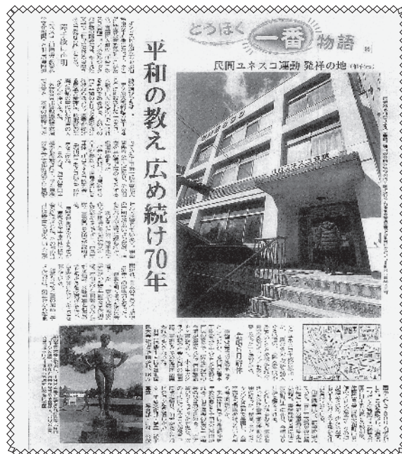
掲載・河北新報2016年3月27日

ユネスコ理念を共有した仲間たちと楽しい活動を推進してきたことが良い思い出であります。