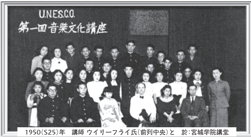
UNESCO 第一回音楽文化講座