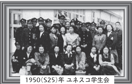
1950(S25)年 ユネスコ学生会