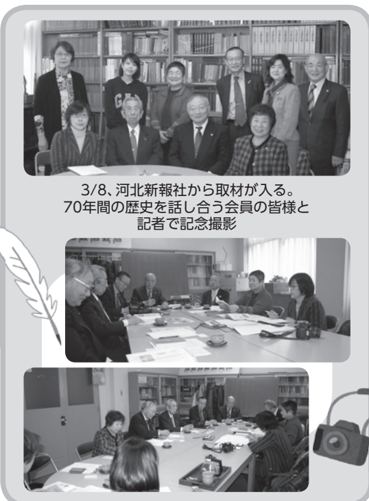
3/8、河北新報社から取材が入る。 70年間の歴史を話し合う会員の皆様と 記者で記念撮影