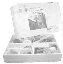
旧仙台会館の写真が入った掛紙

建物(ユネスコ会館)がなくなるということは大変悲しいことでしたが、グリーンテーブルの上に置かれた弁当の包み紙にはユネスコの建物が桜色に描かれていて、「うわー」という声が聞こえ、たいへん感動しました。先人達の思いに向かって前進すること、そして早いうちにユネスコ会館が建つことを皆で祈念して終わりました。