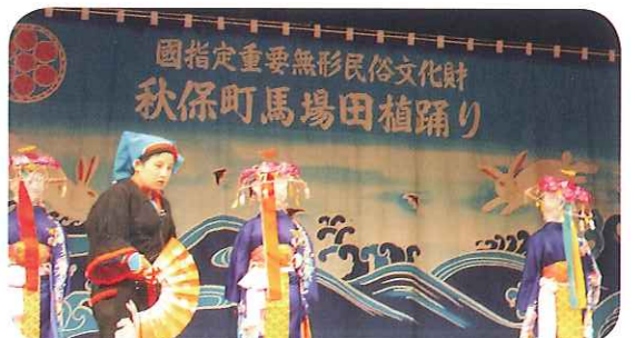
◆ユネスコ無形文化遺産 秋保田植踊 馬場地区の田植踊保存会の皆さん