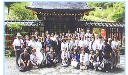
▲Aコース 仙台市内 半日見学コース 瑞鳳殿の前で伊達家 18代当主伊達泰宗様 と共に記念の一枚