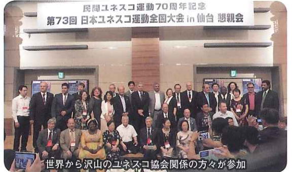
民間ユネスコ運動70周年記念 第73回 日本ユネスコ運動全国大会 in 仙台 懇親会