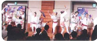
すずめ踊り 宴もたけなわの大賑わい