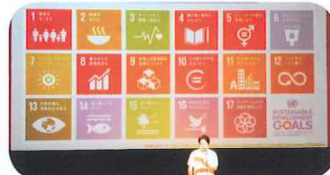
◆民間ユネスコ運動70周年ビジョンの発表