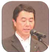
宮城県知事 村井嘉浩 様