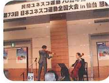
UNESCO 平和芸術家二村英仁氏 バイオリン演奏