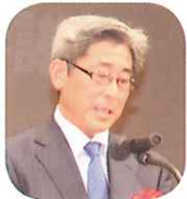
外務省 国際文化交流審議官 宮川 学 様