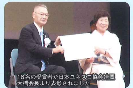
16名の受賞者が日本ユネスコ協会連盟 大橋会長より表彰されました

ら、毎年全国大会に参加して、ユネスコの理念を共有することができたことに感謝しております。今回の表彰は、仙台の場でありました。民間ユネスコ運動発祥の地でのことに感謝いたしました。一番前に席を設けていただき、開会から最後まで聞くことができたことは、何か意味があるのではないかと、思いを深くしております。最高の仲間と時間を共有し、健康でできる限り精進して参りたいと思います。