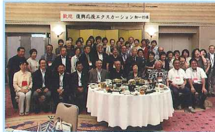
▲Bコース 世界遺産平泉の 歴史と浄土思想 中尊寺貫首様に 聞く1泊2日の旅