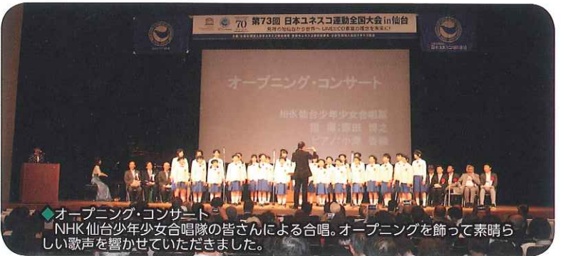
◆オープニング・コンサート NHK仙台青少年少女合唱隊の皆さんによる合唱。オープニングを飾って素晴らしい歌声を響かせていただきました。