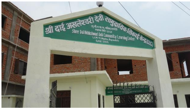
完成したマシナ寺子屋（ルンビニ）

2016年度は、2015年のネパール中部（ゴルカ）地震で建物被害を受けた寺子屋1軒の再建をネパール東部のラメチャップ郡で進めています。また、外部支援によってルンビニで1軒新しい寺子屋が完成しました。ほかに、震源に近いゴルカ郡の被災した寺子屋の再建が進められています。