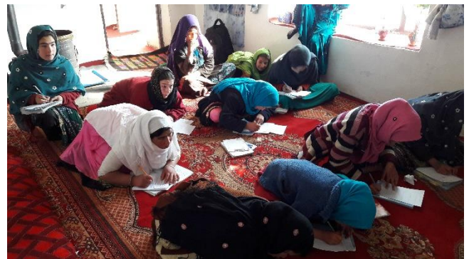
識字クラスの卒業試験