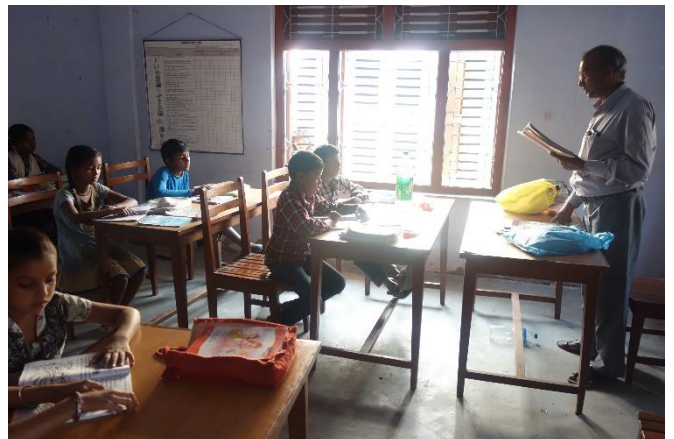
寺子屋で実施された小学校クラス