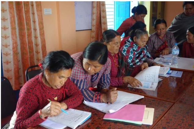
寺子屋で実施された女性たちのための識字クラス

2016年度は、4ヵ月間の中級識字クラスを行い、1,622人が卒業することができました。識字クラスでは、ネパール語の読み書きだけでなく、フォローアップを目的とし、中級のネパール語の読み書き・計算だけでなく、公衆衛生や女性の権利などについても学びました。クラスの開始前には、識字教員への教授法の研修も行い、識字クラスの質の向上にも努めました。