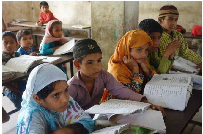
マドラサ（イスラム教の学校）で実施された小学校クラス

ネパール寺子屋プロジェクトでは、識字クラスや小学校クラスの開始前には、教員への研修を実施しています。ほかにも、寺子屋を運営するボランティアの運営委員への年間計画策定や会計についての研修も実施しました。