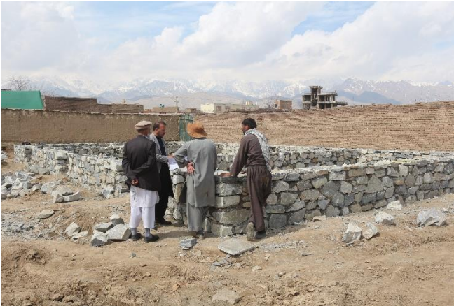
建設中の寺子屋 (2017年3月時点)

建物の完成後は、地域の人びとによるボランティアの寺子屋運営委員会の組織化や識字クラス・職業訓練を開始する予定です。