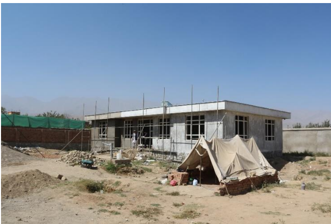
完成に近づいている寺子屋 (2017年10月時点)

30年以上にわたる戦争により学校や教育システムが破壊されたアフガニスタンでは、幼少期に学校がなかったり、学校に通うことを禁じられたりしたため、字の読み書きができないまま大人になった人びとがたくさんいます。