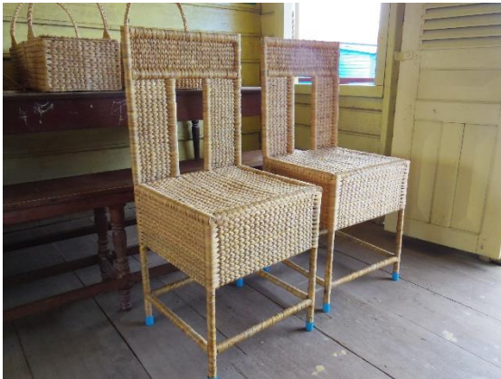
ホテイアオイの新品・椅子

シェムリアップ州のチョンクニア、プレイクロッチ、コックスロックの各寺子屋は、運営委員会がきちんと機能し、識字支援が終わるなどの条件を満たし、2017年度から支援を“卒業”して自立運営に移行しました。チョンクニア寺子屋では、貧困層の女性の職業訓練として始まったホテイアオイ製品作りは、作り手の女性たちのアイデアで新しい商品が毎年生み出され、いまでは村の発展を支えています。