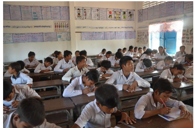
中学校で学ぶ“寺子屋卒業生”たち

小学校を中途退学した児童向けに寺子屋で行う「復学支援クラス」を卒業した子どもたちが、公立の中学校でさらに学び続けられるよう、学用品や制服支給などの進学支援を行っています。2016年度に中学校に進学した人数は149人になり、学び続ける環境をサポートしています。