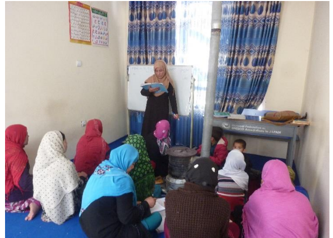
寺子屋で実施された女性たちのための識字クラス

ほかにも、識字クラスの教員研修への教授法の研修や寺子屋運営委員への運営研修などの能力開発も実施しました。