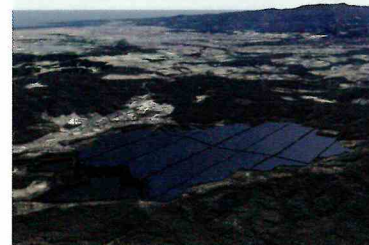
宮崎県における太陽光発電事業 年間発電容量は96.2MWと一般家庭3万世帯分の年間電力消費量に相当

MUFGでは豊富な実績とノウハウ並びに国内外に広がる拠点網を活かし、太陽光・風力・地熱発電をはじめとするプロジェクトファイナンス等のアレンジや融資を通じて、世界の再生可能エネルギーの普及に貢献しています。2017年には再生可能エネルギー事業に関連したファイナンスのリードアレンジャー世界ランキングで2016年に続き第1位となりました。