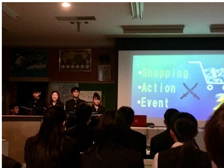
名古屋ユネスコ協会