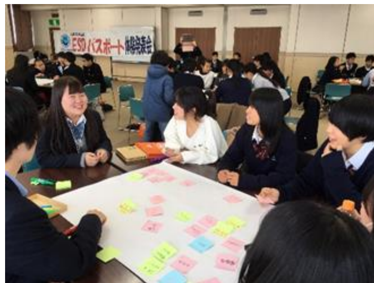
大阪府ユネスコ連絡協議会