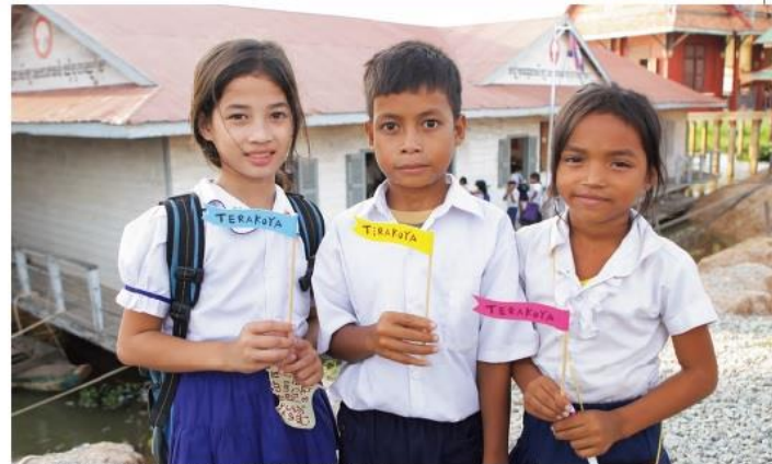
カンボジア、トンレサップ湖畔のチョンクニア寺子屋に通う子どもたち