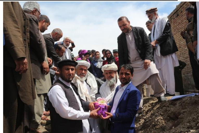
バグラミ寺子屋の起工式の様子