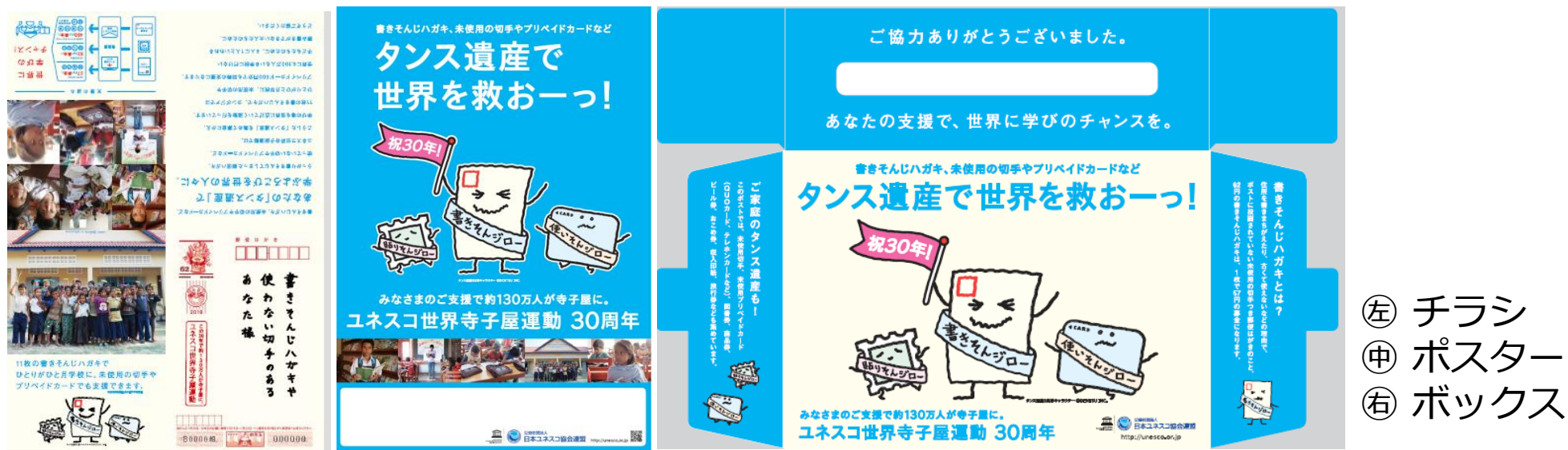
① チラシ ② ポスター ③ ボックス