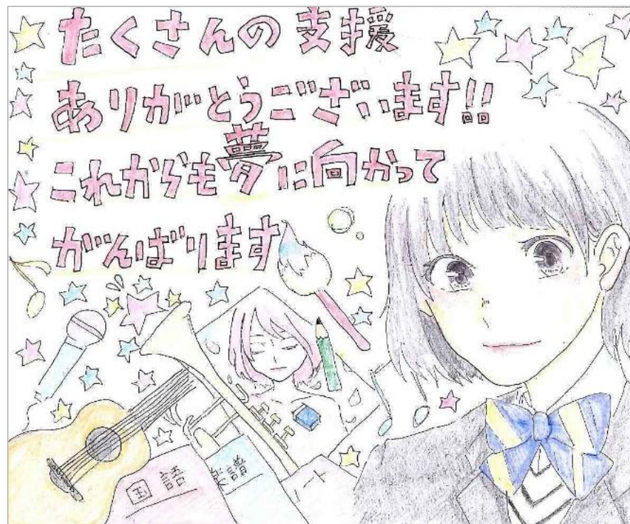
(奨学生からのお手紙)