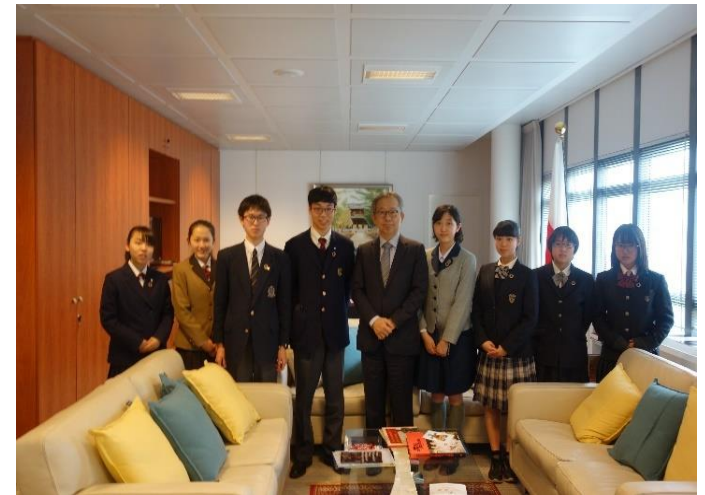
UNESCO日本政府代表部 山田大使への表敬訪問