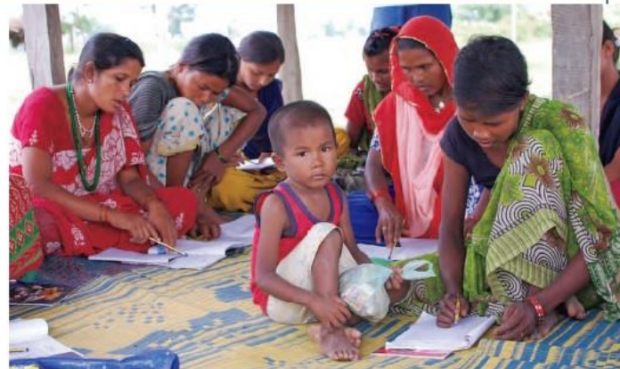
子連れで寺子屋の識字クラスに通うお母さんも少なくない(ネパール・ルンビニ)