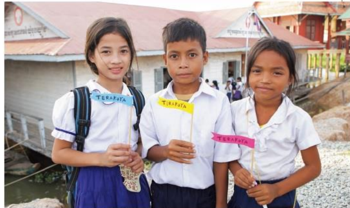
カンボジア、トンレサップ湖畔のチョンクニヤ寺子屋に通う子どもたち