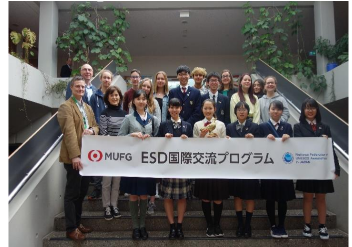
ドイツのユネスコスクールへの訪問