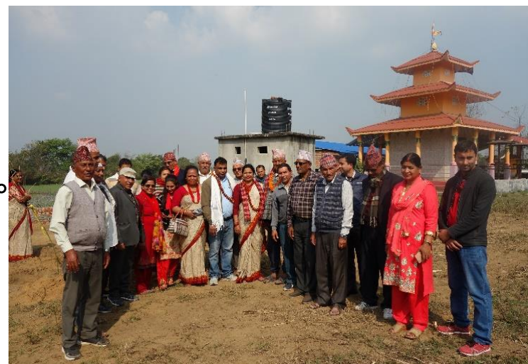
ギタナガール寺子屋の建設予定地