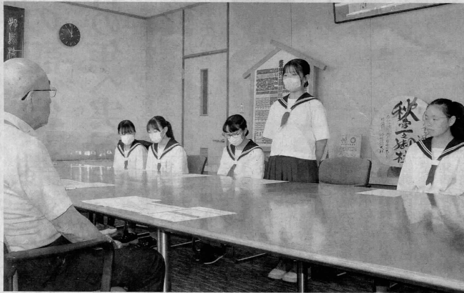
宮坂徹町長に研修で感じたことを話す生徒

下諏訪町教育委員会は7日、2023年度「広島平和教育体験研修」の報告会を町役場で開いた。2、3の両日に広島市を訪れて戦争の悲惨さや原爆の恐ろしさなどを学んだ町内の中学2年生8人が、研修を通じて感じたことを宮坂徹町長に報告した。8人は15日の戦没者追悼式(町主催)の会場でも、参加者を前に研修の学びを発表する。 研修は、下諏訪の将来を担う若い世代に平和の尊さを学んでもらおうと、1999年度から毎年実施している。今年度は平和記念公園を訪れ、下諏訪中学校と下諏訪社中学校の両校の生徒が作った千羽鶴を奉納。広島平和記念資料館も見学し、被爆体験者の話を聞いた。