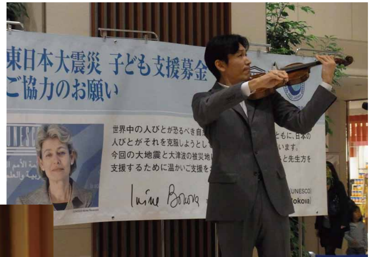
UNESCO 平和芸術家 バイオリニスト 二村英仁さん