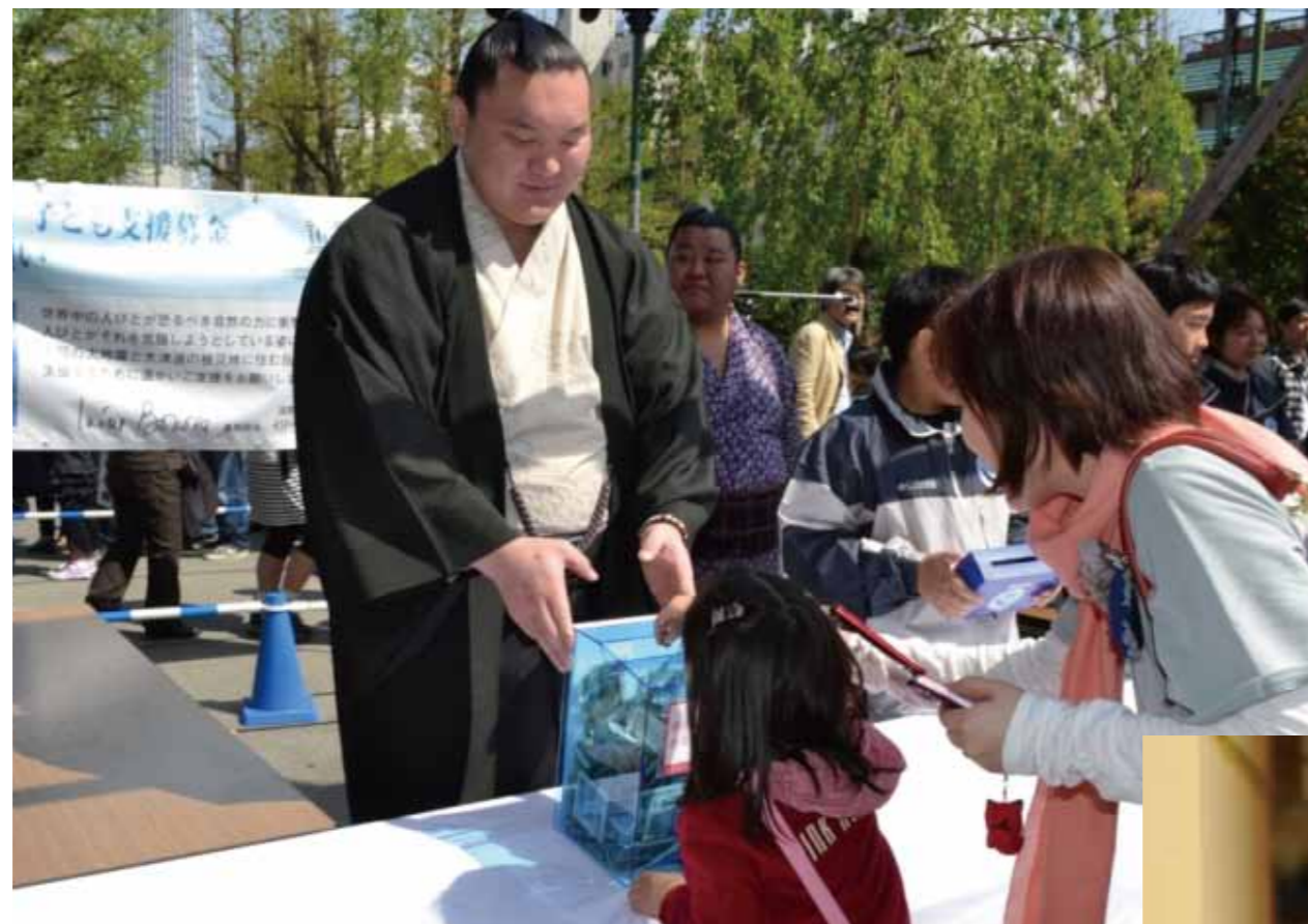
UNESCO スポーツチャンピオン 日本相撲協会 第六十九代横綱 白鵬関