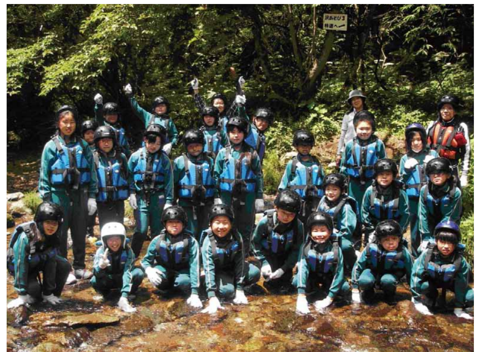
遠足代などの支援