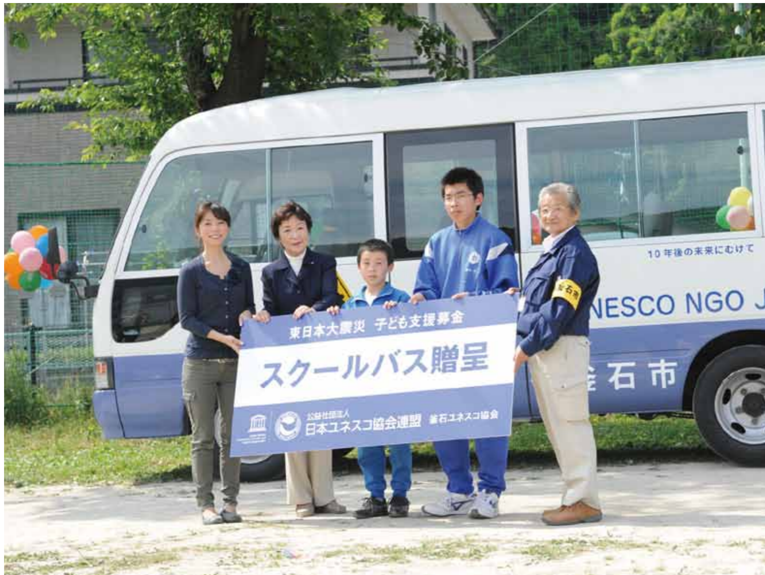
スクールバスの支援