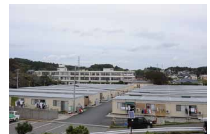
校庭の半分以上は、仮設住宅になってしまいました。

夏休みが明けて、仮設住宅が完成しました。児童全員の住む場所が確保され、一安心しています。しかし、働く場所を失い、収入が安定しない生活は保護者にとって大きな課題であると思います。そんな中で、今までと違った生活環境や見えない不安の中で寝られなかったり、ちょっとしたことでイライラを感じると答える子どもが増えています。各家庭が安定した生活を送れるまでどれくらいの時間がかかるかわかりませんが、互いに支え合いながら新しいものを作りあげ、生活に自信が持てるようになったときに初めて元の生活に戻ったといえるのだと思います。