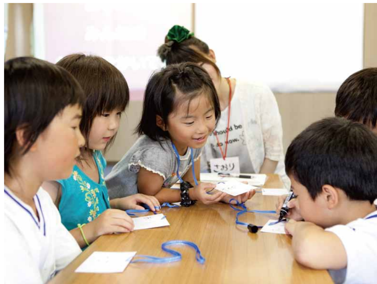
学童保育所の支援