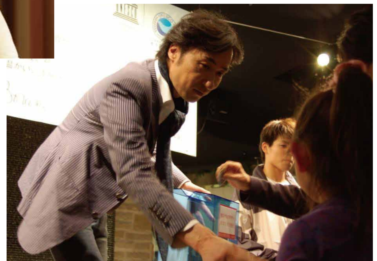
日本ユネスコ協会連盟 スペシャルアドバイザー 雅楽師 東儀秀樹さん