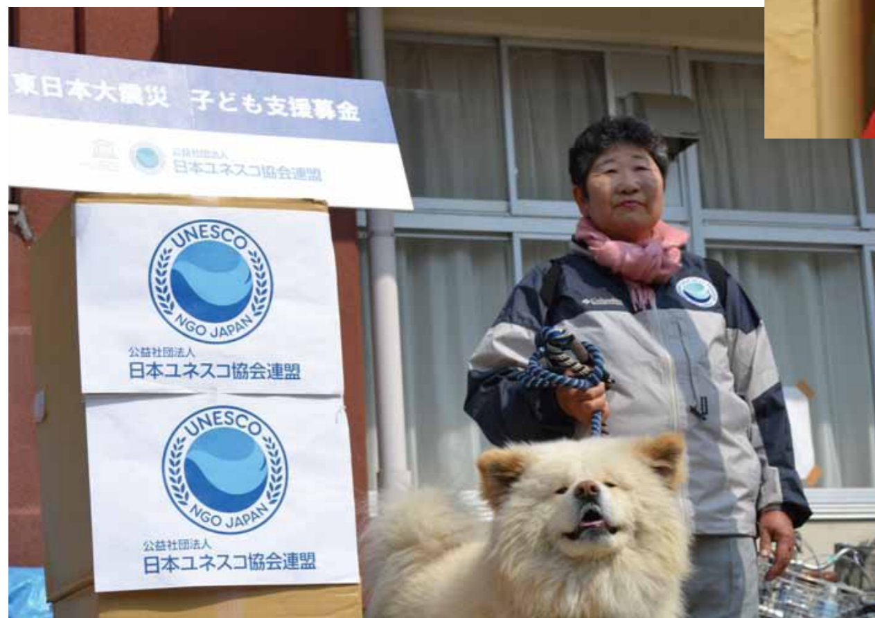
日本ユネスコ協会連盟 世界遺産活動特別大使“犬”(ワンパサダー) わさおくん