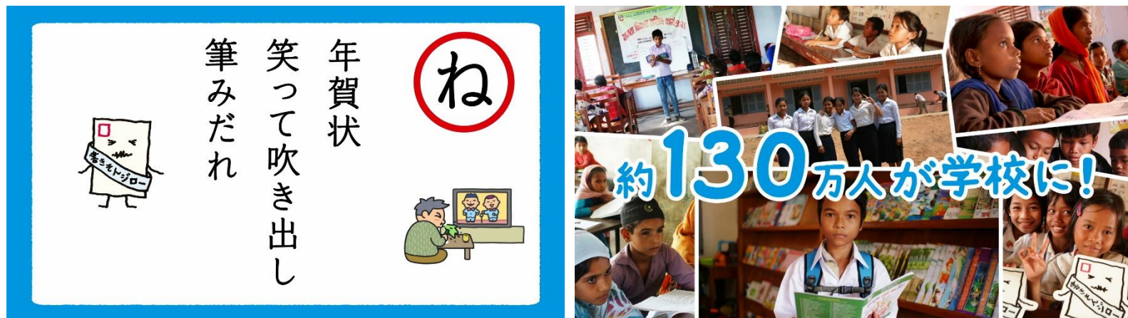
動画のワンシーンより