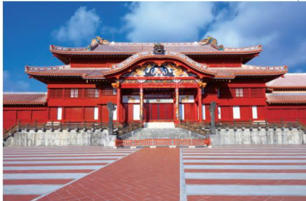
首里城 首里城は、「首里城跡」として、世界遺産「琉球王国のグスク及び関連遺産群」の構成資産のひとつとして登録されている。