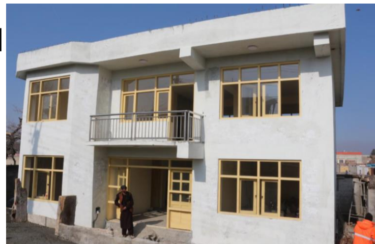
バグラミ寺子屋の建設状況（9割完成）