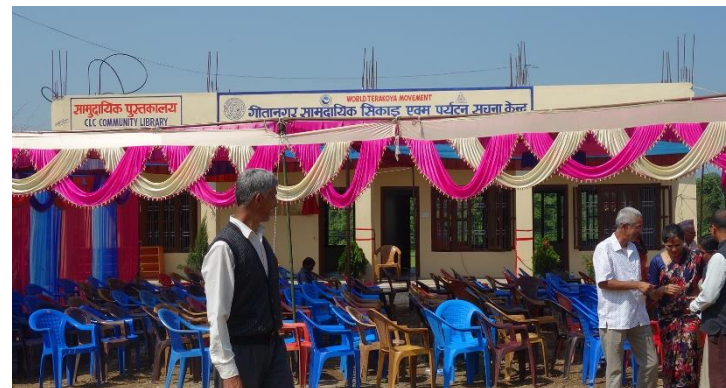
ギタナガール寺子屋の外観 20