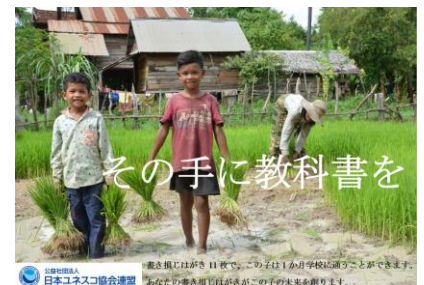
東京都立三田高等学校 Y・Y