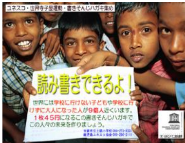
鹿児島県・日置市立土橋小学校 4・5・6年生