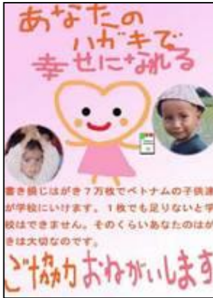
石川県金沢市立扇台小学校