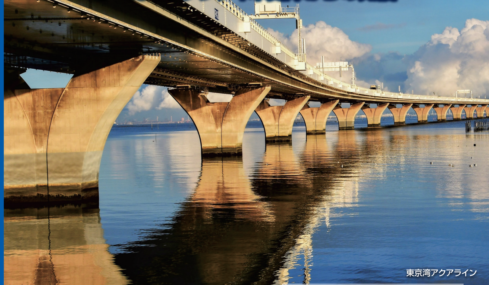
東京湾アクアライン