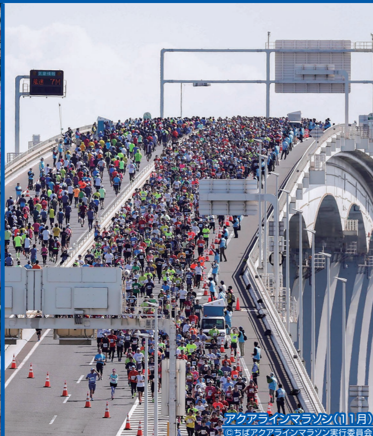
アクアラインマラソン(11月)