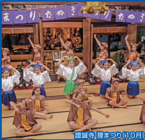
證誠寺狸まつり(10月)