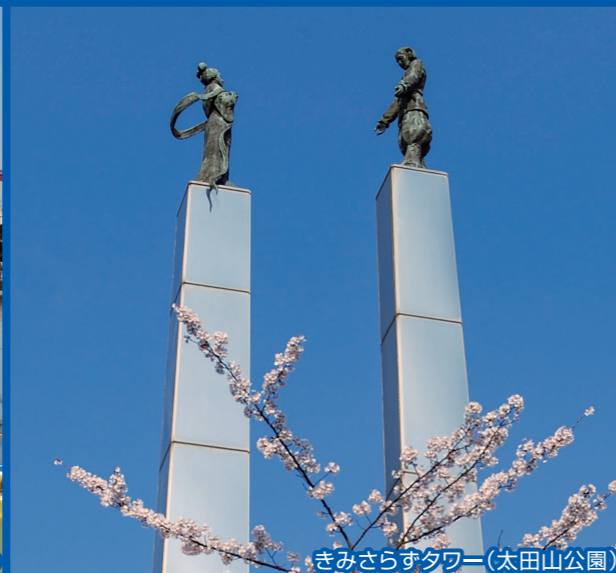
きみさらずタワー(太田山公園)