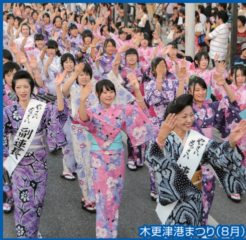
木更津港まつり(8月)