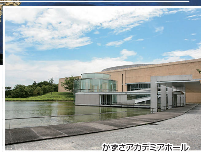
かずさアカデミアホール