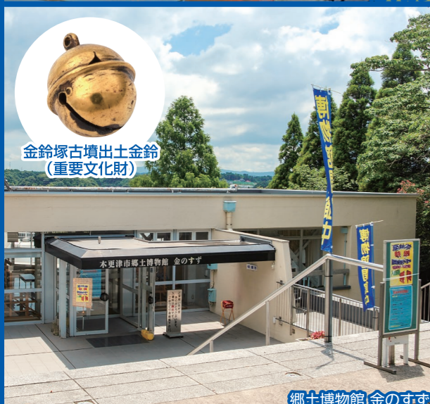
金鈴塚古墳出土金鈴 (重要文化財)