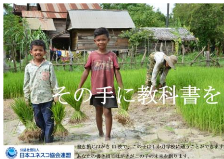
東京都立三田高等学校 Y・Y