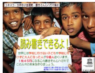
鹿児島県・日置市立土橋小学校 4・5・6年生