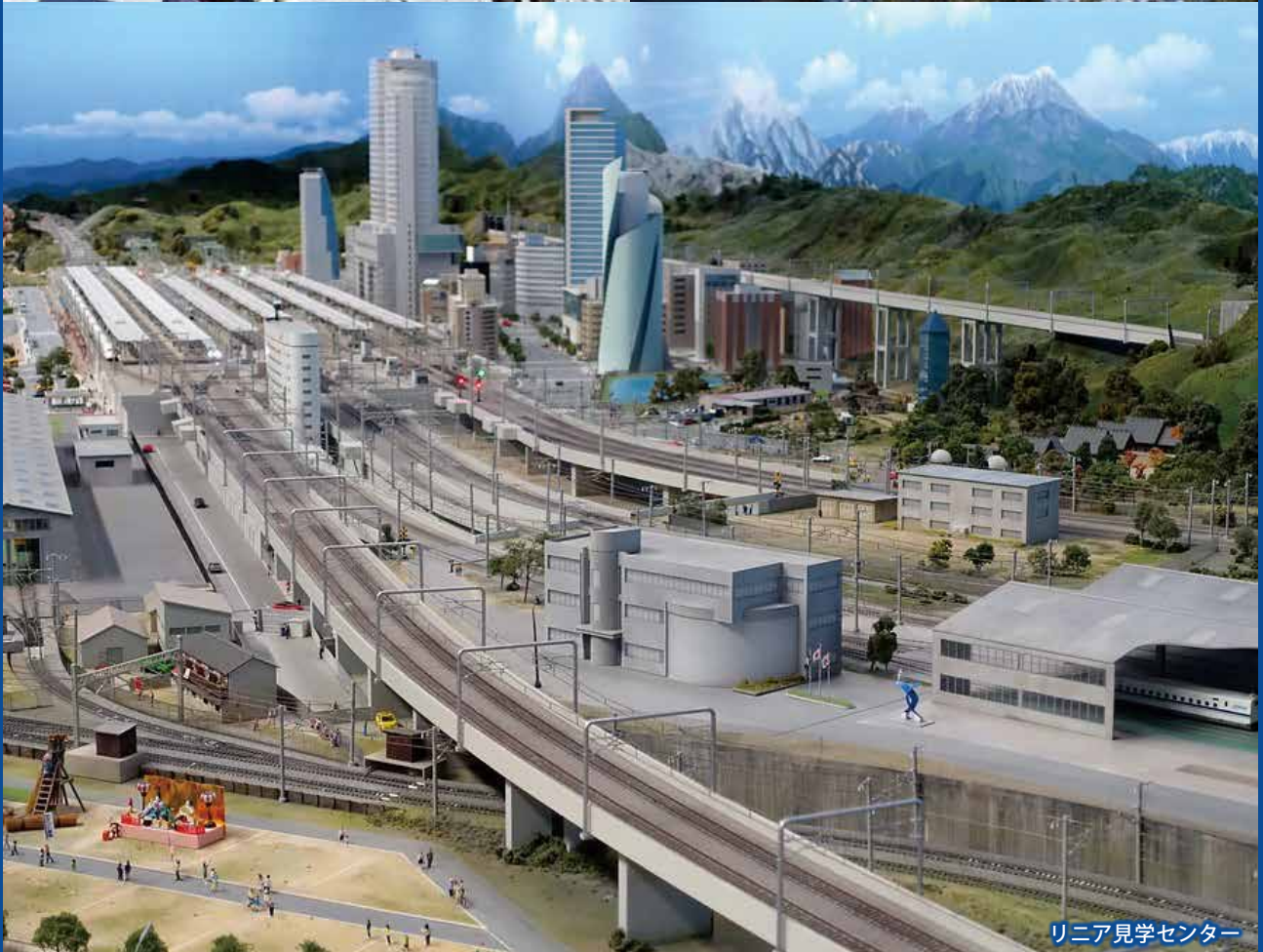
リニア見学センター