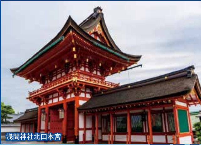
浅間神社北口本宮