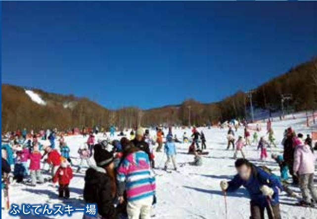
ふじてんスキー場