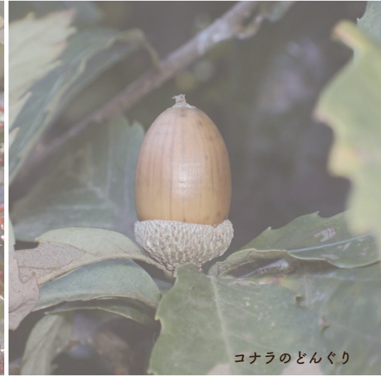
コナラのどんぐり