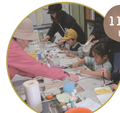
ワークショップ (柏の葉 T-SITE 共催)

2023年春、当 NPO の活動 「市民で育てる 100 年の森」が 日本ユネスコ協会連盟の 「プロジェクト未来遺産」に登録され、 「こんぶくろ池自然博物公園」は 千葉県「ちば文化資産」に選定されました