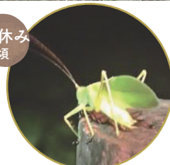
夜の昆虫観察会 (柏の葉 T-SITE 共催)