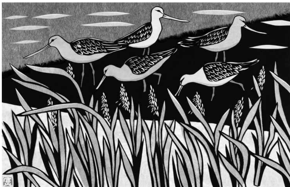
ハマニンニクの穂が出る頃に