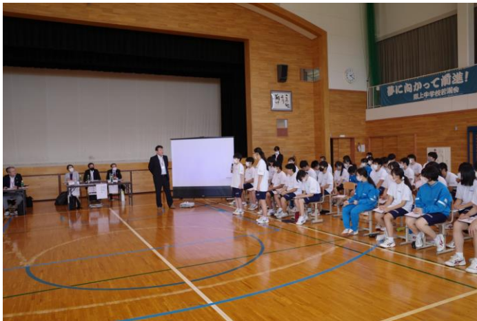
参加者と中学生の質疑応答、ディスカッションの様子