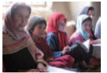
アフガニスタンの寺子屋で学ぶ子どもたち

世界寺子屋運動は、発展途上国の貧しい地域に学びの場をつくり、読み書きや生活をよくするための技術を学ぶよう応援する活動です。現在はアフガニスタン、ネパール、カンボジア、ミャンマーの4カ国で、人々が明日を生きる力を育てています。